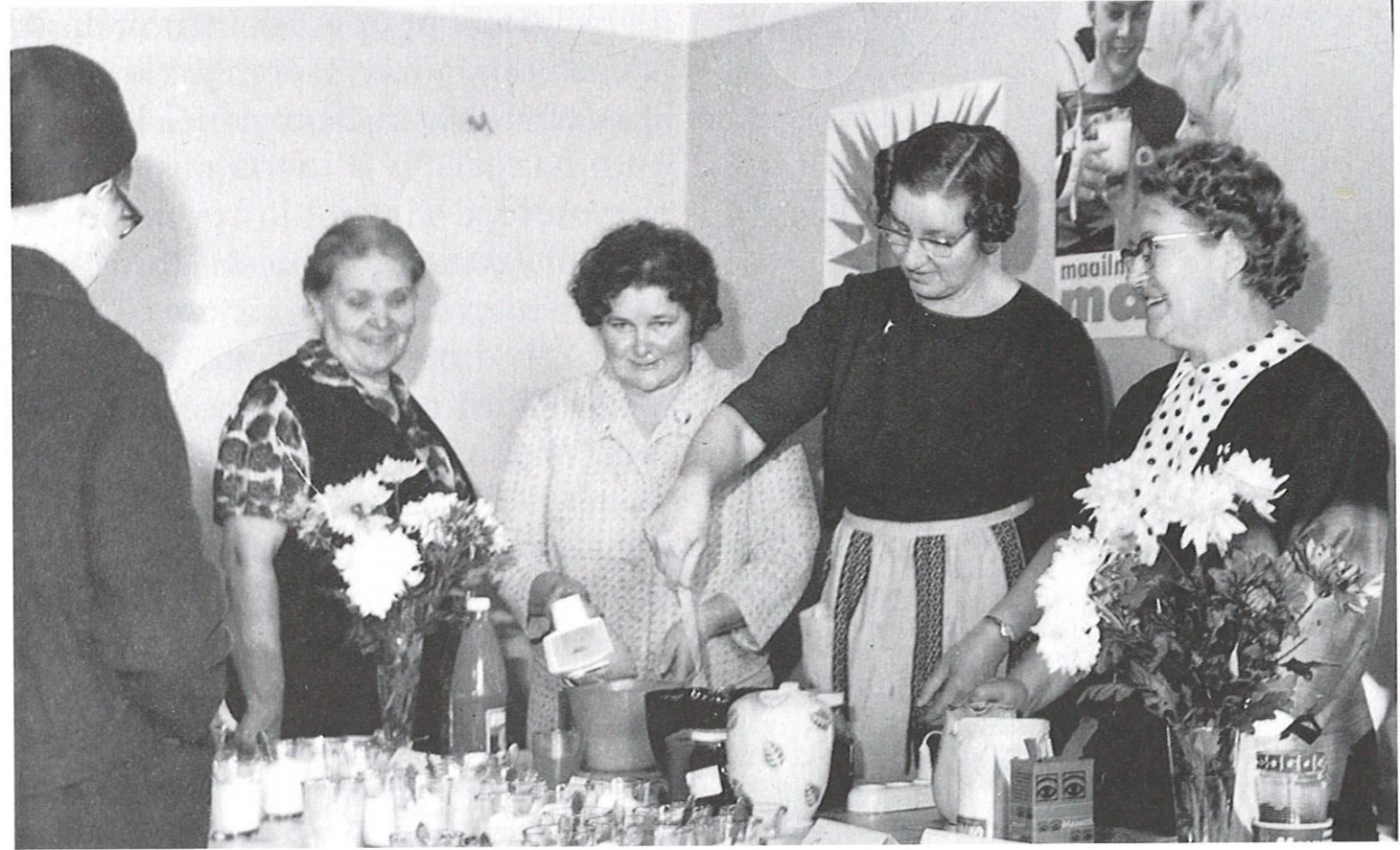
Kuvassa Pieksämäen Valkonauhan maitopohjaisten juomien esittelytilaisuus 19.10.1964.

Suomen Valkonauhaliitto järjesti 1960-luvulla maitopohjaisten juomien esittelytilaisuuksia.