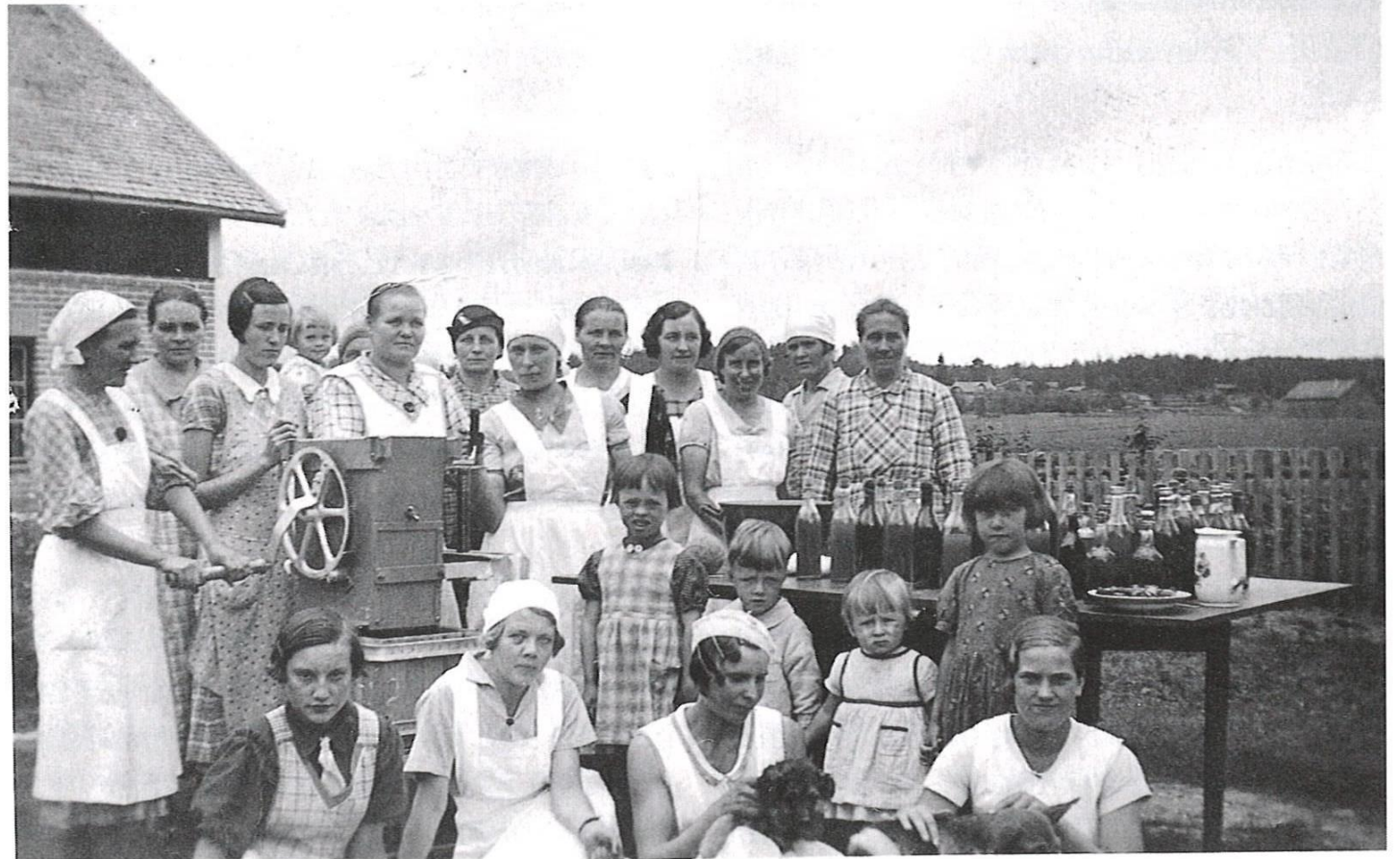
Tuoremehukurssi Mynämäellä 1936. Tärkeä hankinta oli kuvassa näkyvä Sussen Most -tuoremehukone, joka hankittiin Saksasta.

Suomen Valkonauhaliitto järjesti tuoremehukursseja yhdessä Marttojen ja Lotta Svärd -järjestön kanssa.