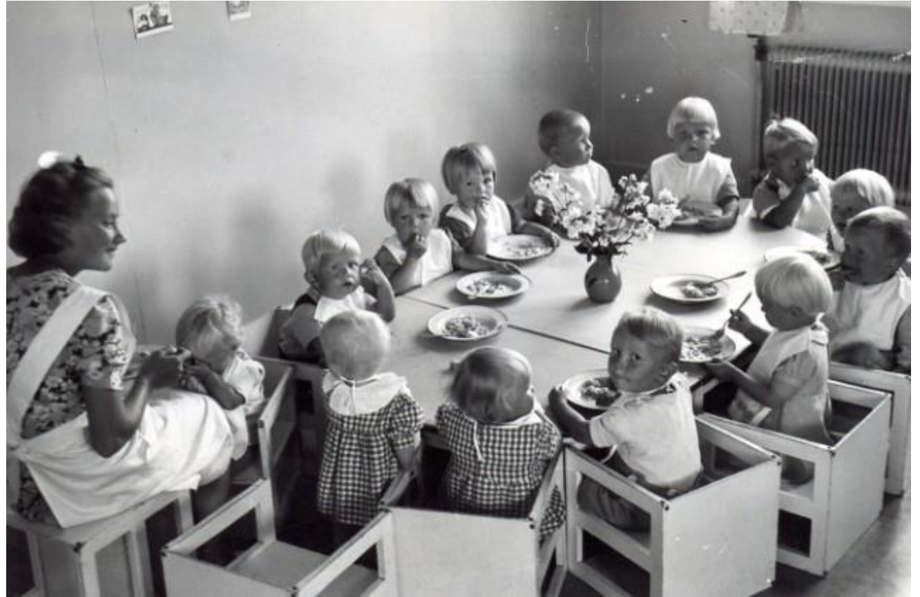
Porilaisen päiväkodin lounastuokio 1940-luvulla.

1940-luvulla sota-ajan kriisihetkissä Mannerheimin Lastensuojeluliitto vahvisti perheiden voimavaroja muun muassa päiväkotitoiminnalla, joka oli suosittua, kun moni äiti joutui yksin huolehtimaan perheen elatuksesta ja lastenhoidosta.